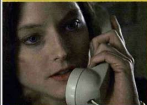
Clarice Starling, impersonata da Jodie Foster, è la famosa psicologa protagonista di Il silenzio degli innocenti.